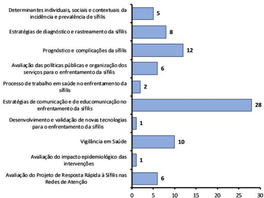
Figura 3 - Distribuição das pesquisas com relação às linhas de pesquisa. Natal, RN, 2019.

Na Figura 3, pode-se observar a distribuição quanto às linhas de pesquisa. A linha relativa às estratégias de comunicação e educomunicação respondem pela maior frequência, seguida pelo diagnóstico e rastreamento da sífilis. Menores frequências aparecem para as novas tecnologias para enfrentamento e a avaliação de impacto epidemiológico.